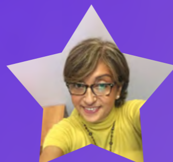
Grazia Senior Account