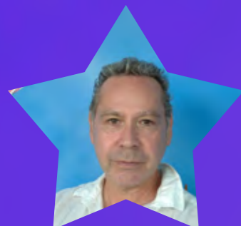
Carlo Senior Account