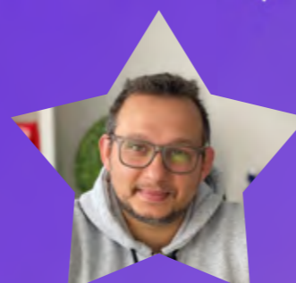
Domenico Producer e Logistica