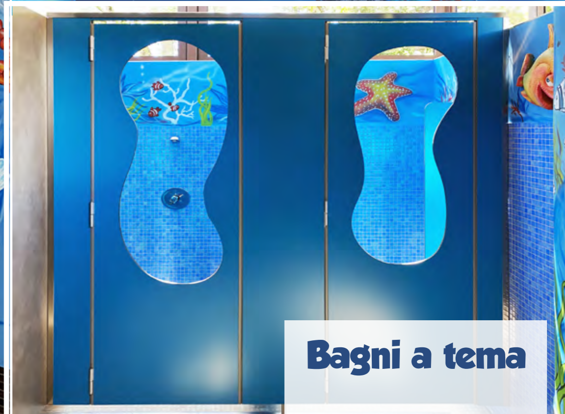
Bagni a tema