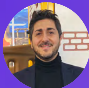
Christian Senior Account